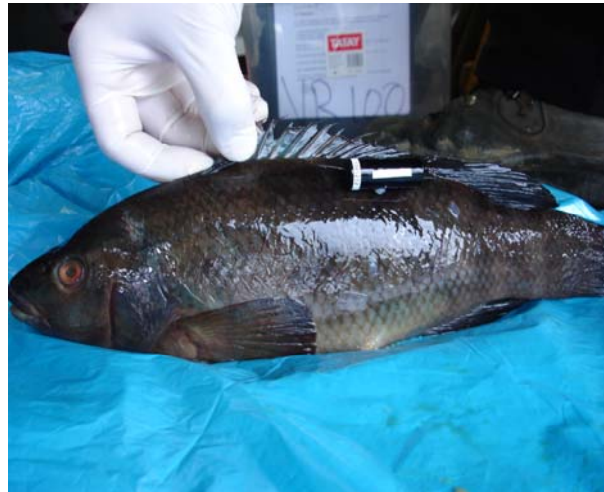
Maragota con un pinger de telemetría sobre su dorso.