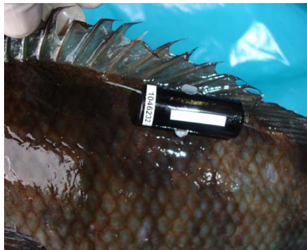
Detalle de la inserción del pinger de telemetría sobre el animal